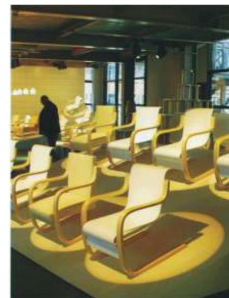
экспонат и предметная аранжировка